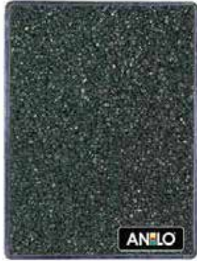
ANL2668 0.8/1.2 mm