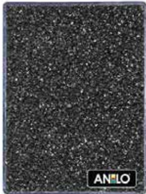
ANL2672 0.8/1.2 mm