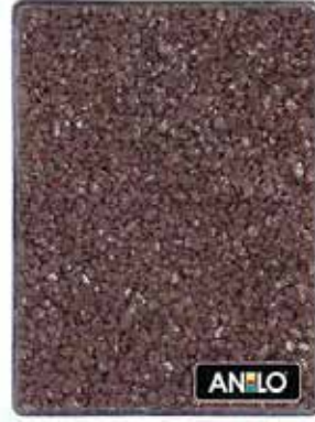
ANL2678 1.5/2.5 mm