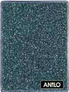
ANL2671 0.8/1.2 mm