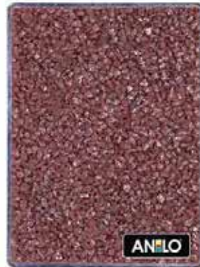
ANL2675 0.8/1.2 mm