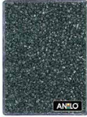
ANL2677 1.5/2.5 mm