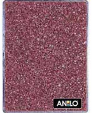
ANL2670 0.8/1.2 mm