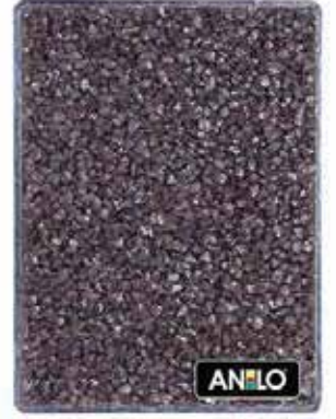
ANL2679 1.5/2.5 mm