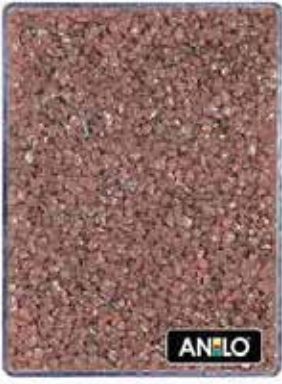
ANL2680 1.5/2.5 mm