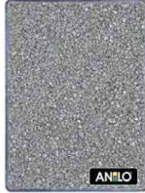
ANL2669 0.8/1.2 mm