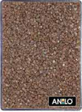
ANL2676 1.5/2.5 mm